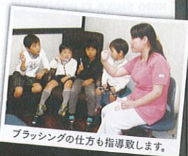
ブラッシングの仕方指導致します。

愛育歯科には、歯科医院としては珍しく看護師、助産師、保育士、幼稚園教諭が在籍しており、ご両親の子育ての不安や疑問などを解消するサポートをしています。