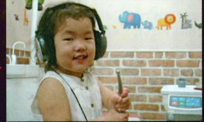
おひこうさん。がんばったね!