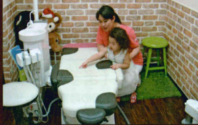
「診療台の柄はウシさんなんだよ」「ほんとだ。黒い模様があるね」少しずつ慣れてきてくれました。