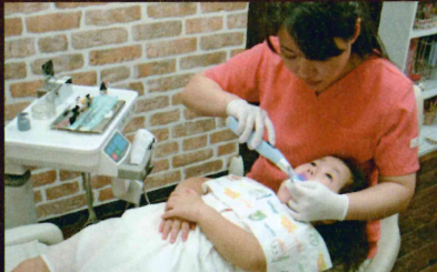
「おひこうさんのポーズ」。手はお腹の上で、さあ、治療開始です。