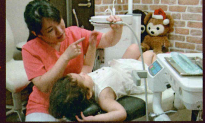
「ウシさんの背中にゴロンしたい」診察台にあがるのが出来ました。「器具も怖くないよ」やさしく説明します。