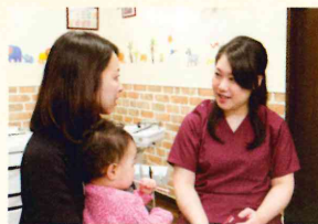
幼児が歯磨きを嫌がらない工夫などを先生がたくさん教えてくれる

光が差し込む明るい院内に入ると、落ち着いた木目調の内装と、それに合うアンティークのかわいらしい小物に囲まれたキッズスペースが目にとまる。木馬やぬいぐるみ、宝箱があって子どもでなくとも温かい気持ちになるような雰囲気だ。また、治療ユニットにもたくさんのおもちゃがあり、母親が診療中も楽しく子どもが待てるような工夫が多くある。そんな同院では、小児