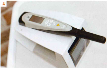
3.ユニットの周りには子どもが楽しく治療を受けられる工夫がいっぱい 4.歯に当てるだけで虫歯の進行具合を数値化できる機器

「小児審美治療」や「将来の咬合や発育に寄与する治療」にまで踏み込んだ診療を提供しているのが同院の強みだ。また、院内は来院者がリラクセスできるように意識された空間になっている。「痛みを感じる方には精神状態が大きく影響します。緊張時やイライラしているときのほうが痛みを感じやすいんですよ」と院長。同院では、顔の上にかけるタオルの肌触りや香りにも配慮がなされている。治療においては、特殊な波長の音楽を流すことで歯を削る不快音を消していくノイズホワイトニングを取り入れているそう。 「児の母である院長自身、子どもを持ってから医療や子育てに対する考え方が大きく変わったそう。『お子様の口腔内管理を完璧に行うことは、子育てを完璧に行うことが困難なことと同じくらい難しいことです。