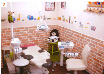
1. アンティーク雑貨に彩られた清潔な院内には日の光がふんだんに差し込んでいる 2. 特徴的な牛柄ユニットは子どもに大人気。安心して座ってくれるそう

小児歯科として、「痛くない、楽しく治療する、小児専用の器具や機材をそろえている」ことは当然のこととし、